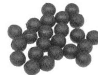
Kulki gumowe kal. 10 mm Kod produktu: R1.R.BALL