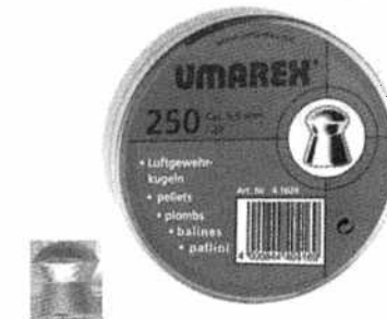
Śrut ołowiany UMAREX kal. 5,5 mm Kod produktu: 4.1626