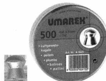
Śrut ołowiany UMAREX kal. 4,5 mm Kod produktu: 4.1625