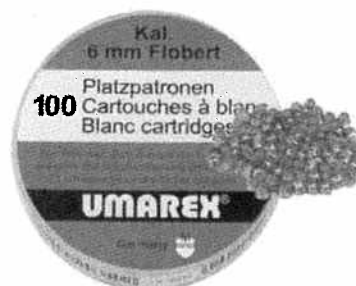
Naboje hukowe UMAREX kal. 6mm Kod produktu: 4.1000