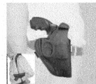
Kabura - kod prod. 3.1581 Szelki - kod prod. 3.1509