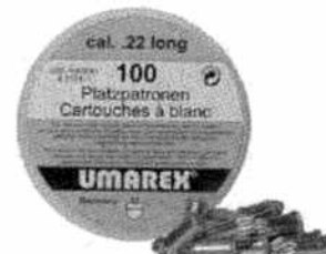
Naboje hukowe UMAREX kal. 6mm long Kod produktu: 4.1121-1