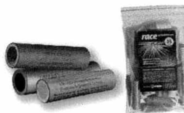
Race pirotechniczne 25 szt. Kod produktu 4.9025