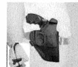
Kabura - kod prod. 3.1511 - wersja 2.5" Kabura - kod prod. 3.1597 - wersja 4.5" Szelki - kod prod. 3.1509