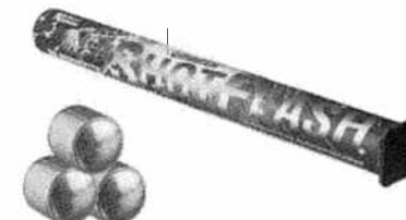
Race pirotechniczne 10 szt. Kod produktu: 4.1555