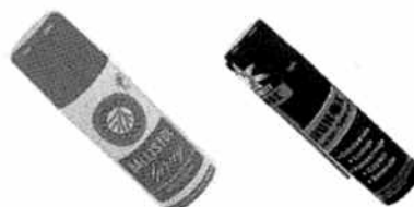
Ballistol - do czyszczenia lufy kod prod. 3.2002