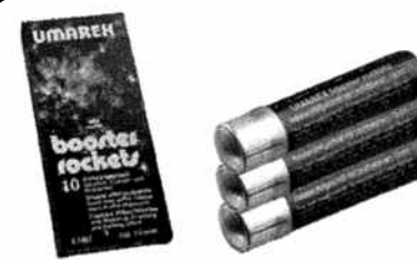
Race pirotechniczne 10 szt. Kod produktu 4.1487